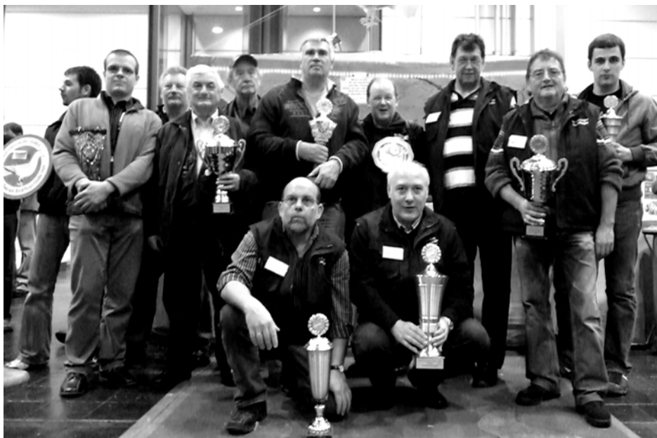
Erfolgreiche Züchter und Aussteller in Leipzig