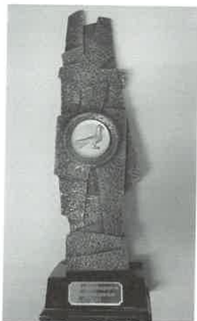
Pokal auf die beste Gesamtleistung (12 Tiere)