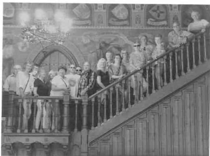
Im alten Göttinger Rathaus