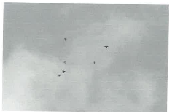
Hochflug in Neumünster