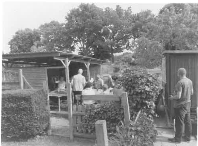
Züchtertreffen im Garten