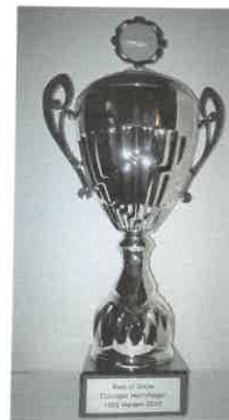
„Best of Show“ Pokal auf das beste Tier in Verden