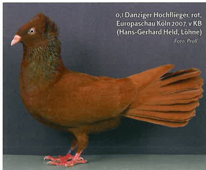
0,1 Danziger Hochflieger, rot, Europaschau Köln 2007, v KB (Hans-Gerhard Held, Löhne)

Ein Höhepunkt im Vereinsleben wird die Jubiläums-Hauptsonderschau sein, die vom 4. bis 6. Dezember 2009 im Rahmen der 58. VDT-Schau in Leipzig durchgeführt wird. Sofern die Vorbereitungen es