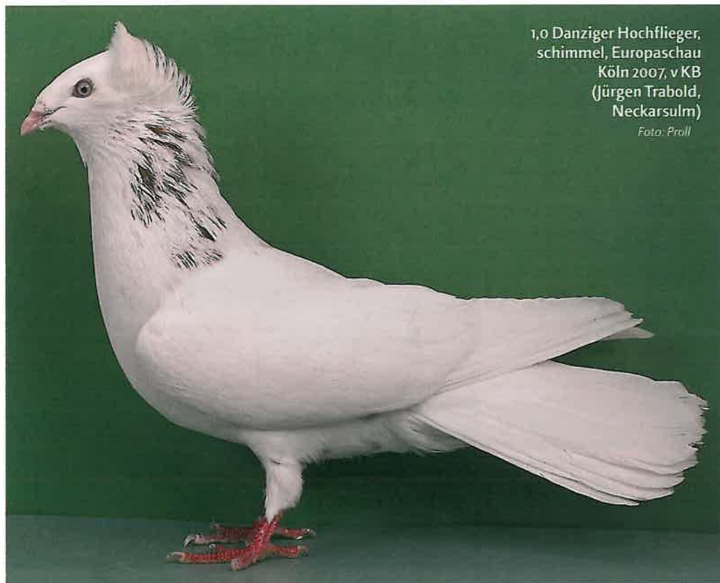
1,0 Danziger Hochflieger, schimmel, Europaschau Köln 2007, v KB (Jürgen Trabold, Neckarsulm)

Wer als Hochflugbegeisterter Erfolg haben möchte, der bedient sich alter Zuchtstämme, die nur zum Fliegen gehalten wurden. So hat sich leider auch die Anzahl der Züchter, die sich aktiv mit dem Hochflugsport beschäftigen, in den letzten Jahrzehnten deutlich reduziert. Dennoch ist es immer wieder ein unbeschreibliches Erlebnis, einen Stich Danziger im Freiflug zu sehen. Allein das Beobachten der Tiere im Flug, wie sie sich als Jungtiere langsam zum Trupp formen und dann in immer höhere Flugzonen bis in die Wolken vordringen und einige Zeit in ihnen verschwinden, bedeutet Ausgleich und Erholung in der hektischen und dem Stress der heutigen Zeit. Dazu bedarf es keiner allzu großen Anstrengungen: ein schöner Sommertag, ein