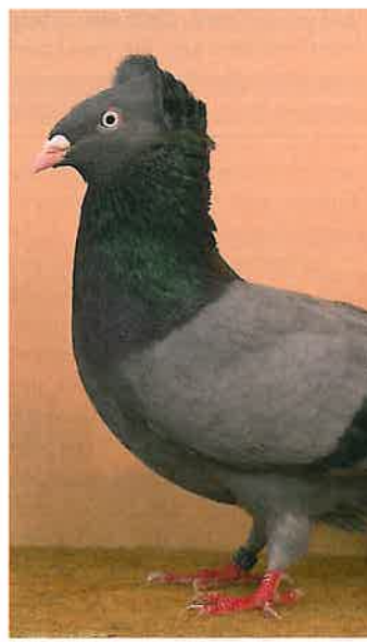
1,0 Danziger Hochflieger, blau mit schwarzen Binden, Europaschau Köln 2007, v KB (Norbert Küpker, Twistring)

schauen, wird der SV dort auch mit einem Infostand aufwarten, um 100 Jahre SV-Geschichte zu präsentieren.