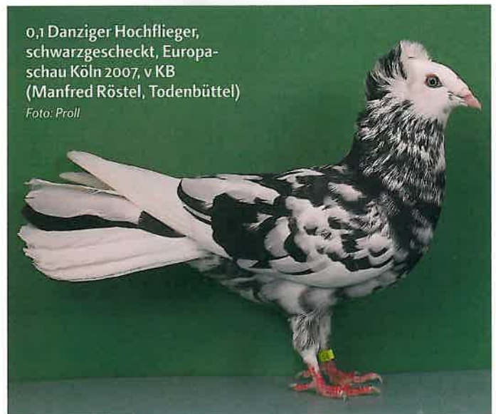
0,1 Danziger Hochflieger, schwarzgescheckt, Europaschau Köln 2007, v KB (Manfred Röstel, Todenbüttel)

Die Bunten in Rot sind zwar leider wenig verbreitet, doch die Spitzentiere sind sehr ansprechend in der Qualität und sollten dem einen oder anderen Mut machen, sich mit diesem herrlichen Farbenschlag zu beschäftigen. Die Gelbunten sind deutlich weniger verbreitet und können auch in der Qualität nicht an die Rotbunten heranreichen. Bedenkt man, dass nach der Entstehungsgeschichte ein Gelbbunter einmal die gesamten Danziger positiv beeinflusst haben soll, sieht es heute doch sehr