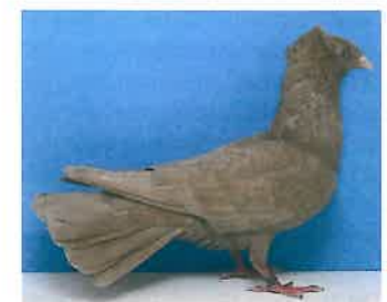
1,0 Danziger Hochflieger, gelb, VDT-Schau 2002, v EB (Horst Knickmann, Twistringern)

Die Schwarz- und Blaugeelsterten sind zwar in ansprechender Anzahl vorhanden, doch die Schwierigkeit, diese Farbenschläge zu züchten, spiegelt sich auf den Schauen wider. Das eine oder andere Spitzentier gibt es bei den