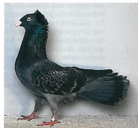
1,0 Danziger Hochflieger, blau-gehämmert, aus der Zucht von Lothar Lange, Bokholt

pe ist eine elegante Erscheinung mit langer Figur, schlankem Hals, schön gezogenem Kopfzug mit hoch angesetzter, voller Haube geworden. Heute sagt die neueste im Standard veröffentlichte Musterbeschreibung aus, dass der Kopf wenig nach unten geneigt getragen wird, ein langes Gesicht aufweist und der Kopf von der Schnabelspitze bis zur Haube eine flache Bogenlinie bildet, von oben betrachtet