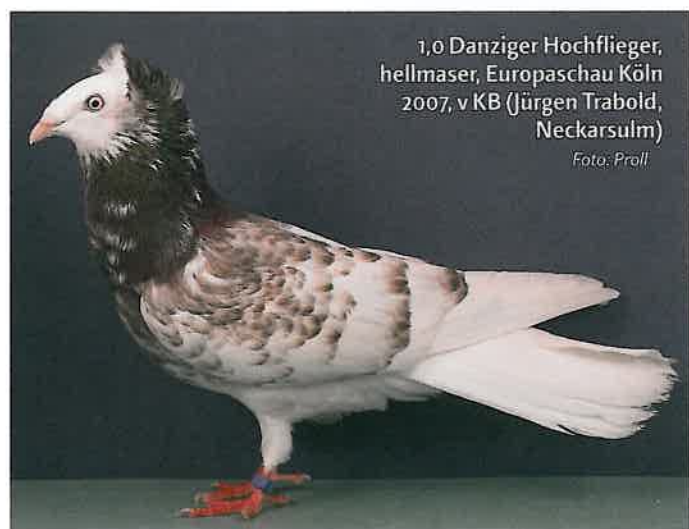
1,0 Danziger Hochflieger, hellmäser, Europaschau Köln 2007, v KB (Jürgen Trabold, Neckarsulm)

auch die erfolgreichsten Aussteller als Gruppensieger ermittelt werden.